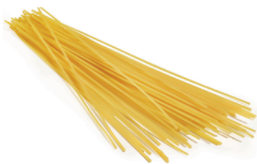
SPAGHETTI AL LIMONE / WITH LEMON