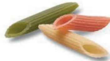
PENNE TRICOLORI WITH CHILLI PEPPER WITH SPINACH